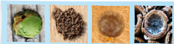
Blattschneiderbiene Mauerbiene Seidenbiene Maskenbiene

Wildbienen legen oft unterirdisch, aber auch in Holz oder Pflanzenstängeln, ihre Nester an. Nur die Weibchen kümmern sich um die Nachkommen. Sie stopfen ein Nektar-Pollengemisch in jede Brutkammer und legen ihre Eier meist einzeln auf diesen Futterproviant. Danach werden die Löcher verschlossen.